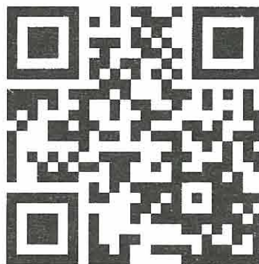
广州幸福工程捐款二维码