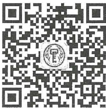
广州人口福利基金会公众号